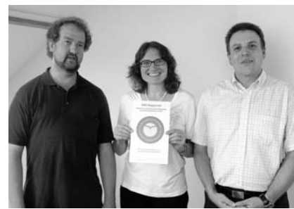
Es ist amtlich: Das BWZ Rapperswil ist eine «gesunde» Schule.